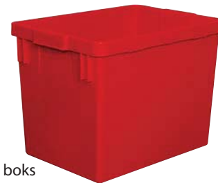
21-liters boks Art.nr 0895 Lokk art.nr 8095.820

Entreprenøren henter og sorterer avfallet.