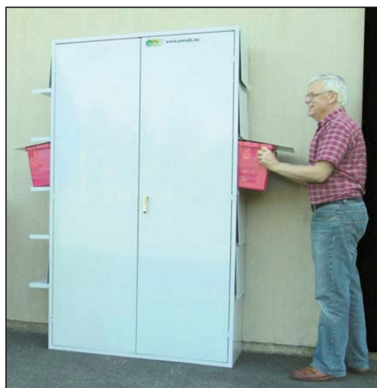
FA-skap Basic Høyde: 2 m, bredde 1,2 m, dybde 0,45 m. Tilpasset for borettslag.

Fleksibiliteten øker også for entreprenøren fordi skapet alltid er tilgjengelig.